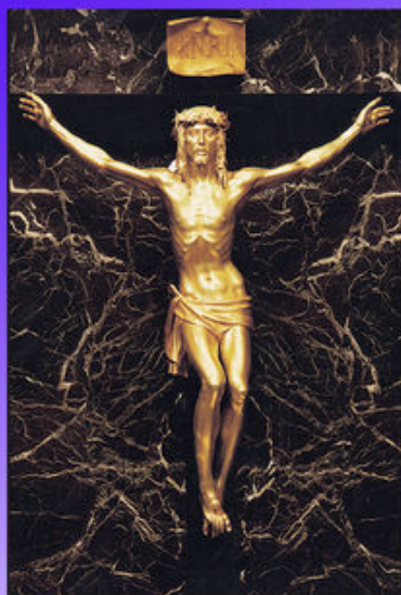
Misal de los Fieles Version 6.5

Misal para seguir la celebración de la Eucaristía y para meditar los textos en la oración. Contiene las lecturas, las oraciones y las antífonas de todas las misas de todos los años: es un misal completo. Totalmente en español. Algunas partes del Ordinario y algunas antífonas se ofrecen en español y en latín. Contiene un completo devocionario con plegarias para antes y después de la Misa.